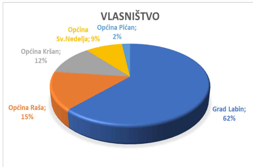
Grafikon 1.: Vlasnička struktura trgovačkog društva 1.MAJ d.o.o.

U 1995. godini izvršeno je usklađenje općih akata sa odredbama Zakona o trgovačkim društvima te se temeljem Rješenja Trgovačkog suda broj: TE-95/383-3 od dana 15.12.1995. godine 1.MAJ d.o.o., Labin upisuje u registar trgovačkih društava.